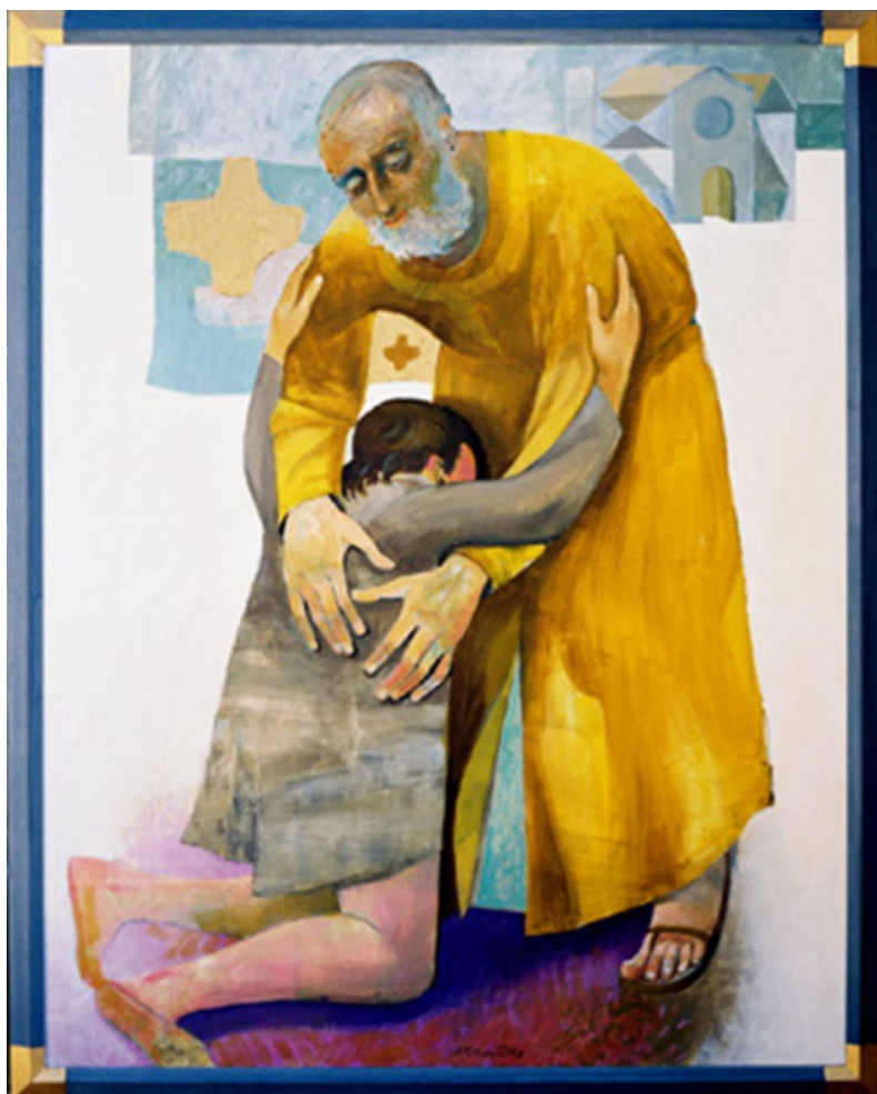
Arcabas, Il Padre misericordioso

c'è lui dentro, operante. (trad. Rainer Maria Rilke, Animamundi edizioni)