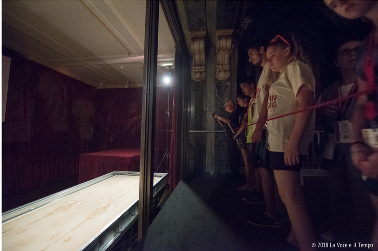
Giovani in venerazione davanti alla Sindone

lingua dell'amicizia se gli stiamo davanti con sincerità, senza arroganza. Esprime durezza quando nel buio della sofferenza vediamo solo disperazione e non il sentiero che porta alla compassione, al perdono. O forse no, forse è proprio quando perdiamo la strada che l'uomo dei dolori ci è più vicino, è quando ci sentiamo più soli che il suo sguardo d'amore ci avvolge. E la mano si apre in una carezza.